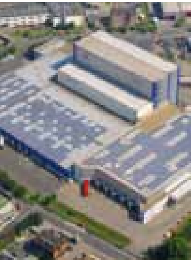
Logistikzentrum Köln 624,96 kWp PV-Anlage 15° Neigung - 25° Ost