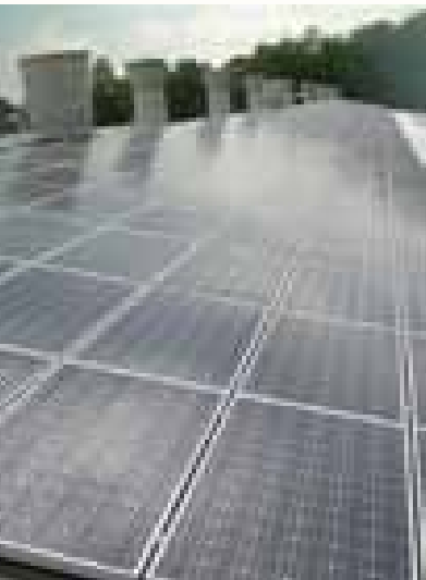
Legehennenfarm Bestensee B6 210,35 kWp PV-Anlage 15° Neigung - 10° West