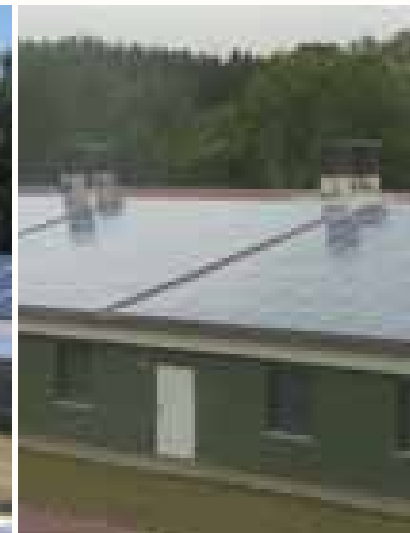
Legehennenfarm Arkeburg 364,64 kWp PV-Anlage 18° Neigung - 2° Ost