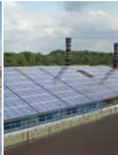
Legehennenfarm Welplage 373,42 kWp PV-Anlage 21° Neigung - 15° West