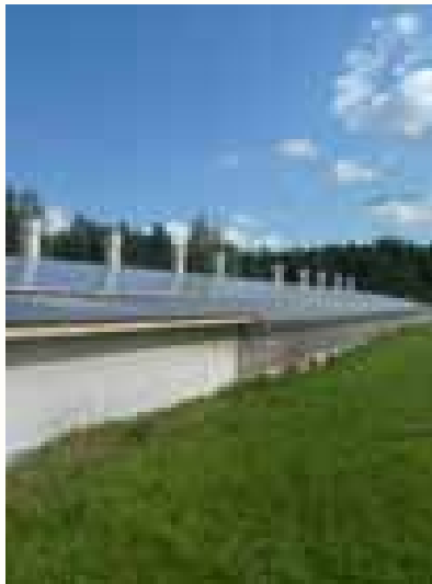
Legehennenfarm Spreenhagen 282 kWp PV-Anlage 15° Neigung - 5° Ost