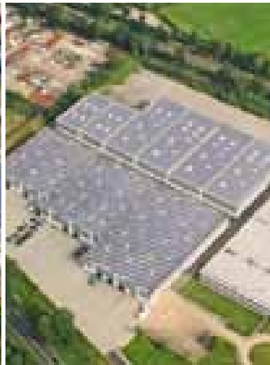
Lagerhalle Mönchengladbach 574,32 kWp PV-Anlage 15° Neigung - 13° West