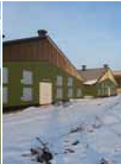
Legehennenfarm Bonrechten 340,4 kWp PV-Anlage 20° Neigung - 8° Ost