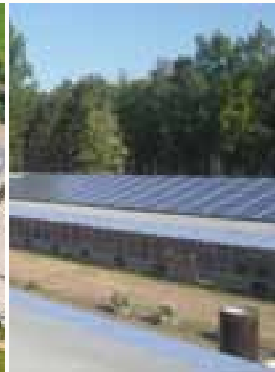
Legehennenfarm Bestensee B1 345,6 kWp PV-Anlage 15° Neigung - 23° West